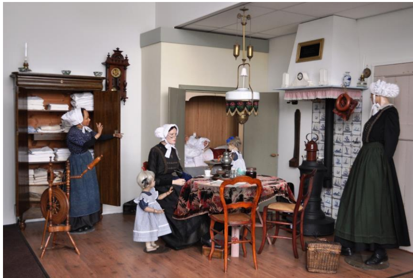
Stijlkamer in het Nederlands Pluimveemuseum te Barneveld

Of neem het pluimveemuseum in Barneveld, dat de bezoeker alles wil vertellen over 'de ontwikkeling van de kleinschalige pluimveehouderij tot de moderne, diervriendelijke bedrijven van nu'. Als we dat 'diervriendelijk' terzijde laten, is het de vraag tot hoever in het heden de blik dan reikt. De afbeeldingen op de website tonen toch vooral interieurs en situaties van voor de oorlog en kort daarna. Nu heb ik het museum persoonlijk nooit zelf bezocht. Mocht het zo zijn dat men in Barneveld ook inzicht geeft in de ontwikkeling van bijvoorbeeld legbatterijen, met verwijzingen naar de discussies die daarover gevoerd zijn, en de transitie naar de scharrelkip- of vrije uitloopstallen die nu geëxploiteerd worden, zou dat mooi wezen. Want dan is er wisselwerking tussen het publiek, de maatschappelijke context en de werkelijkheid van het huidige boerenbestaan. En daar heeft ook huidige generatie boeren belang bij.